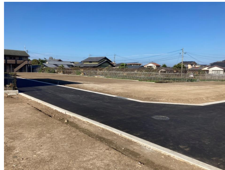
撮影日：令和2年10月6日