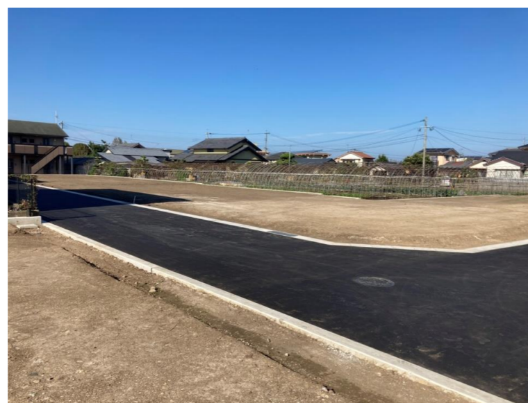
撮影日: 令和2年10月6日