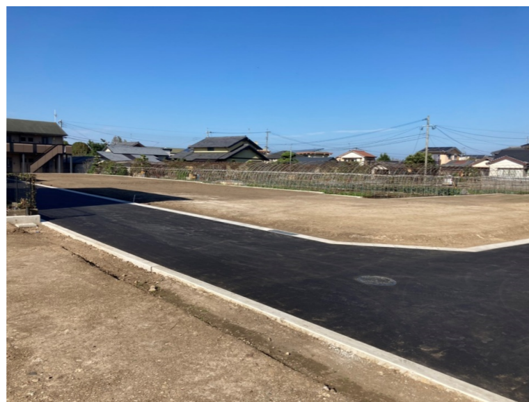
撮影日：令和2年10月6日