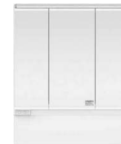
スリムLED3面鏡 ミドルパネル 750