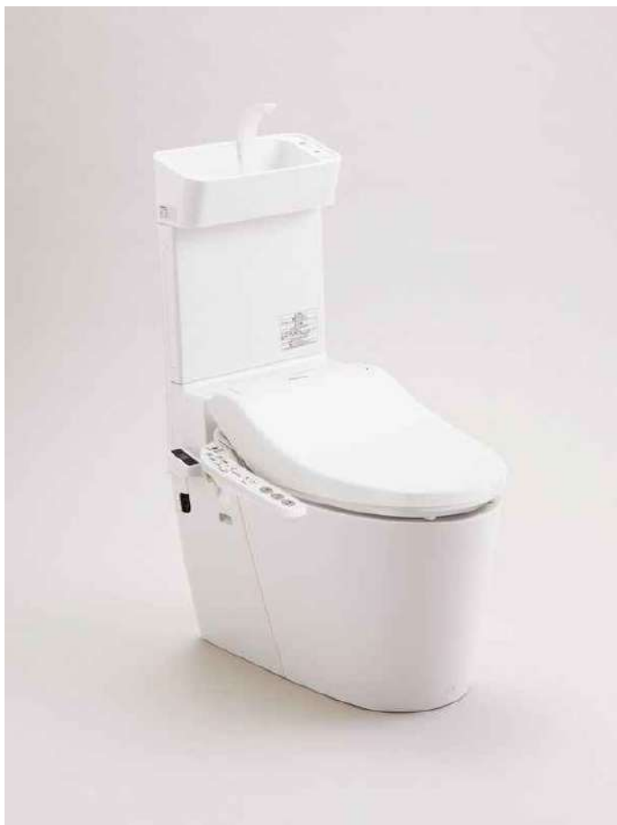
※画像はイメージです。組合せなどはお見積書をご確認ください。