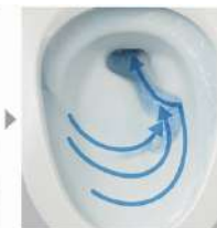
流れの方向を変え、一気に流しきる。

※1 約20年前の当社サイホンセット式トイレ(CH43) ※2 水圧0.2MPaの場合。その他当社基準に基づき測定。N=20台平均。