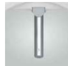
継ぎ目がなく汚れにくいステンレスノズル