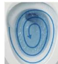
ボール全体をまんべんなく洗う。