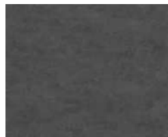
ヴィンテージメタル柄