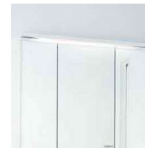
薄型のLED照明で空間すっきり。省エネ・長寿命を実現しています。