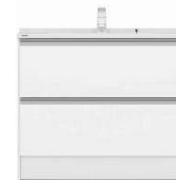
パノラマスライドタイプ