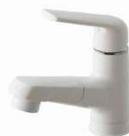
マルチシングルレバーシャワー (スゴビカタイプ) ※シャワーヘッドは引き出せます。