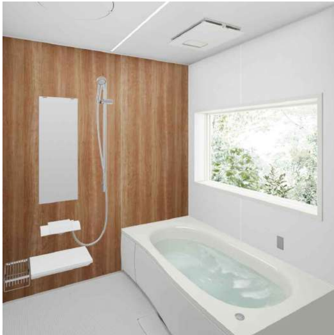
※上記画像はCGIによるイメージ画像です。取付器具・機器の形状及び色柄などは実際の仕様と異なる場合がございます。ショールームなどで現物をご確認いただくことをお勧めいたします。