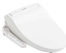
CH328 (脱臭機能付きモデル)