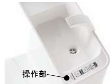
操作部 洗浄ボタンを一箇所に集約したことでスッキリとしたデザインに。便利なワンタッチ操作。