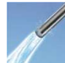
使用前後に自動でノズル洗浄「おまかせノズルクリーニング」