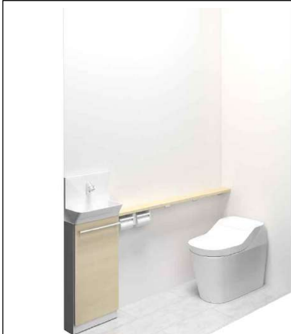
※ご提案いたしましたアラウーノは「タイプ2」です。 ※画像はイメージです。組合せなどはお見積書をご確認ください。 小物は付属しておりません。