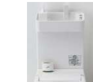
手洗いボールの「ウェットエリア」、芳香剤が設置できる「小物置きスペース」