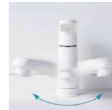
汚れがとれやすく、お手入れしやすい素材。吐水部を左右に首振りできます。