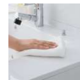
水に濡れた物を置くのに便利なウェットエリア。継ぎ目や隙間がなく、汚れてもささっと拭くだけ。