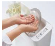
手洗いボールは水アカをはじくスゴピカ素材 (有機ガラス系)。