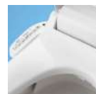
着座センサー搭載で座ったときだけスイッチが入ります