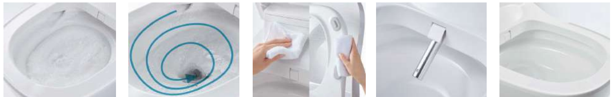
流すたびに、「2種類の泡」と「パワフルな水流」でしっかりおそうじします。 勢いよく旋回しながらまんべんなくキレイに。 汚れのとりにくい便座の合わせ技でスミまでスキマがなくおそうじがスムーズ。 縫い目がなく汚れにくいステンレス製の温水洗浄ノズルです。 水アカをはじくスゴビカ素材。汚れが付きにくく、しかも丈夫です。