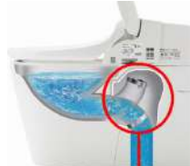
ターントラップ方式