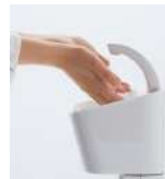
手がさっと届く傾斜したボール。誰もがスムーズに手を洗いやすい。