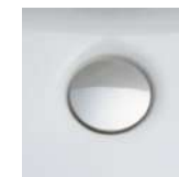
掃除しにくいフチの隙間がない排水口。