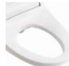
抗菌剤を表面にコーティングした抗菌便座