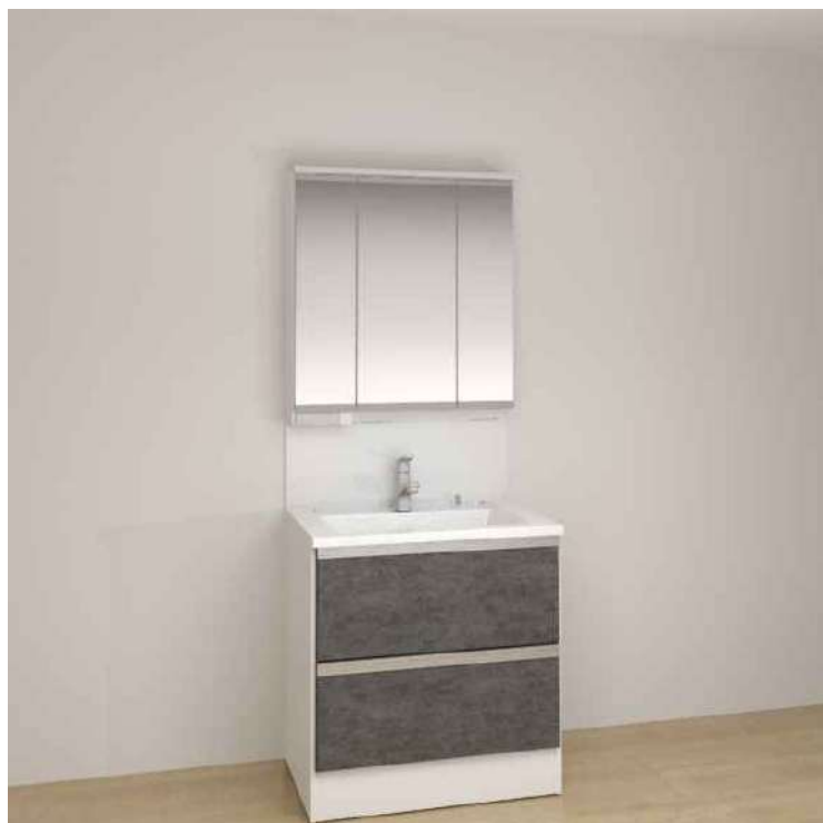
※画像はイメージです。組合せなどはお見積書をご確認ください。