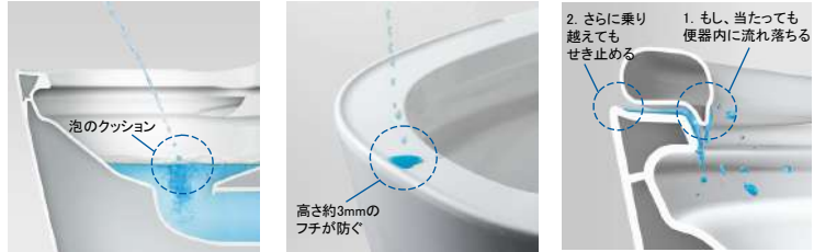
泡のクッションで受け止める「ハネガード」(リモコン式) フチの立ち上がりで、外に垂れ出しにくい「タレガード」。 便座と便器の合わせ技でせき止める「モレガード」。